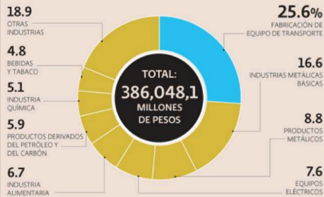
GRÁFICO: EE