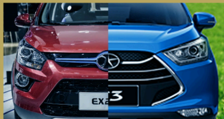
Durante el año pasado México importó 10 mil 443 vehículos asiáticos, lo que significó una alza de 21.7%, con respecto a 2015.

A ocho años de distancia, México registra la llegada de una oleada de marcas del país asiático que tienen el reto de cambiar la mala imagen que dejó FAW y que buscarán convertirse en jugadores importantes en el mercado.