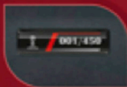
Badje de edición especial