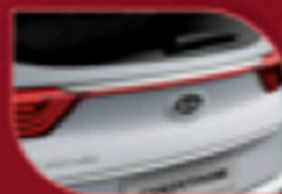
Moldura cromada Tronera